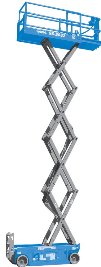
03/17 Ersatzteil Nr. B109378DE